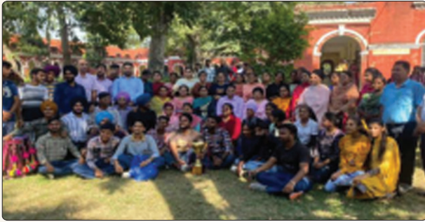
ਗੁਰੂ ਨਾਨਕ ਦੇਵ ਯੂਨੀਵਰਸਿਟੀ ਵੱਲੋਂ ਕਰਵਾਏ ਗਏ ਜ਼ੋਨਲ ਯੁਵਕ ਮੇਲੇ ਵਿੱਚ ਦੂਜਾ ਸਥਾਨ ਹਾਸਲ ਕਰਨ ਉਪਰੰਤ ਜੇਤੂ ਟਰਾਫੀ ਨਾਲ ਕਾਲਜ ਪ੍ਰਿੰਸੀਪਲ, ਸਟਾਫ ਮੈਂਬਰ ਅਤੇ ਵਿਦਿਆਰਥੀ