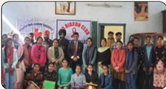
ਕਾਲਜ ਦੇ ਬਾਟਨੀ ਵਿਭਾਗ ਅਤੇ ਰੈੱਡ ਰੀਬਨ ਕਲੱਬ ਦੁਆਰਾ 'World Heart Day' ਦੇ ਮੌਕੇ ਕਾਲਜ ਪ੍ਰਿੰਸੀਪਲ, ਸਾਇੰਸ ਵਿਭਾਗ ਦੇ ਪ੍ਰੋਫੈਸਰ ਸਾਹਿਬਾਨ ਅਤੇ ਵਿਦਿਆਰਥੀ ਨਾਲ