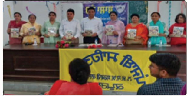
ਕਾਲਜ ਦੇ ਪੰਜਾਬੀ ਵਿਭਾਗ ਦੁਆਰਾ ਛਪਵਾਏ ਗਏ ਸਲਾਨਾ ਮੈਗਜ਼ੀਨ 'ਆਰੰਭ' 2022-23 ਨੂੰ ਲੋਕ ਅਰਪਿਤ ਕਰਦੇ ਹੋਏ ਕਾਲਜ ਪ੍ਰਿੰਸੀਪਲ ਅਤੇ ਸਟਾਫ ਮੈਂਬਰਜ਼