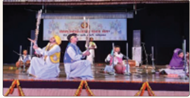
ਗੁਰੂ ਨਾਨਕ ਦੇਵ ਯੂਨੀਵਰਸਿਟੀ ਵੱਲੋਂ ਕਰਵਾਏ ਗਏ ਜ਼ੋਨਲ ਯੁਵਕ ਮੇਲੇ ਵਿੱਚ Folk Orchestra ਵਿੱਚ ਪਹਿਲਾ ਸਥਾਨ ਹਾਸਲ ਕਰਨ ਵਾਲੀ ਕਾਲਜ ਟੀਮ