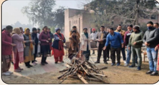
ਕਾਲਜ ਵਿੱਚ ਲੋਹੜੀ ਦਾ ਤਿਉਹਾਰ ਮਨਾਉਂਦੇ ਹੋਏ ਕਾਲਜ ਪ੍ਰਿੰਸੀਪਲ ਅਤੇ ਸਟਾਫ ਮੈਂਬਰ