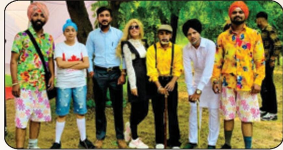
ਗੁਰੂ ਨਾਨਕ ਦੇਵ ਯੂਨੀਵਰਸਿਟੀ ਵੱਲੋਂ ਕਰਵਾਏ ਗਏ ਜ਼ੋਨਲ ਯੁਵਕ ਮੇਲੇ ਵਿੱਚ ਸਕਿੱਟ ਵਿੱਚ ਦੂਜਾ ਸਥਾਨ ਹਾਸਲ ਕਰਨ ਵਾਲੇ ਕਾਲਜ ਵਿਦਿਆਰਥੀ