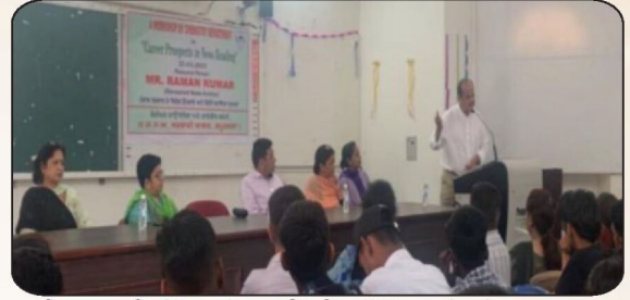
ਕੈਰੀਅਰ ਕਾਊਂਸਲਿੰਗ ਅਤੇ ਗਾਈਡੈਂਸ ਸੈੱਲ ਵੱਲੋਂ ਕਰਵਾਏ ਗਏ 'Extension Lecture' ਮੌਕੇ ਸ਼੍ਰੀ ਰਮਨ ਕੁਮਾਰ, ਸੀਨੀਅਰ ਪੱਤਰਕਾਰ ਆਪਣੇ ਵਿਚਾਰ ਸਾਂਝੇ ਕਰਦੇ ਹੋਏ