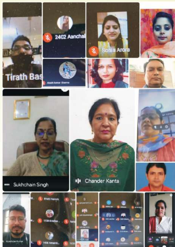
ਕਾਲਜ ਦੇ ਹਿਸਟਰੀ ਵਿਭਾਗ ਵੱਲੋਂ ਭਾਰਤ ਦੀ ਆਜ਼ਾਦੀ ਦੀ 75ਵੀਂ ਵਰੇਗੰਡ ਮੌਕੇ ਵੈਬੀਨਾਰ ਕਰਵਾਇਆ।