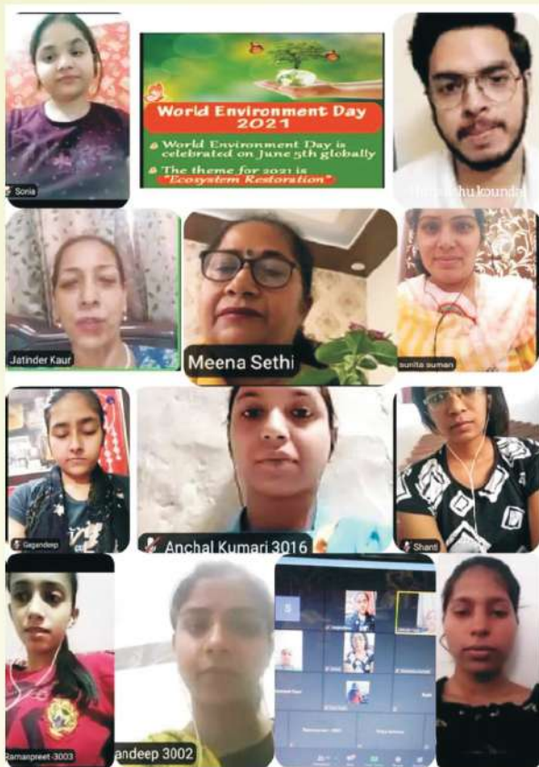
ਕਾਲਜ ਦੇ ਸਾਇੰਸ ਵਿਭਾਗ ਵੱਲੋਂ ਵਿਸ਼ਵ ਵਾਤਾਵਰਨ ਦਿਵਸ ਮੌਕੇ “ਈਕੋਸਿਸਟਮ ਰੀਸਟੋਰੇਸ਼ਨ” ਵਿਸ਼ੇ ਉੱਤੇ ਵੈਬੀਨਾਰ ਕਰਵਾਇਆ ਗਿਆ।