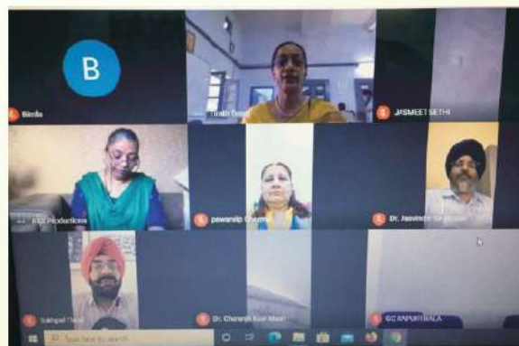
ਕਾਲਜ ਦੇ ਹਿਸਟਰੀ ਵਿਭਾਗ ਵੱਲੋਂ ਗੁਰੂ ਤੇਗ ਬਹਾਦਰ ਜੀ ਦੇ 400ਵੇਂ ਪ੍ਰਕਾਸ਼ ਪੂਰਬ ਦੇ ਮੌਕੇ “ਗੁਰੂ ਤੇਗ ਬਹਾਦਰ ਜੀ-ਜੀਵਨ ਅਤੇ ਵਿਚਾਰ” ਵਿਸ਼ੇ ਤੇ ਵੈਬੀਨਾਰ ਕਰਵਾਇਆ।