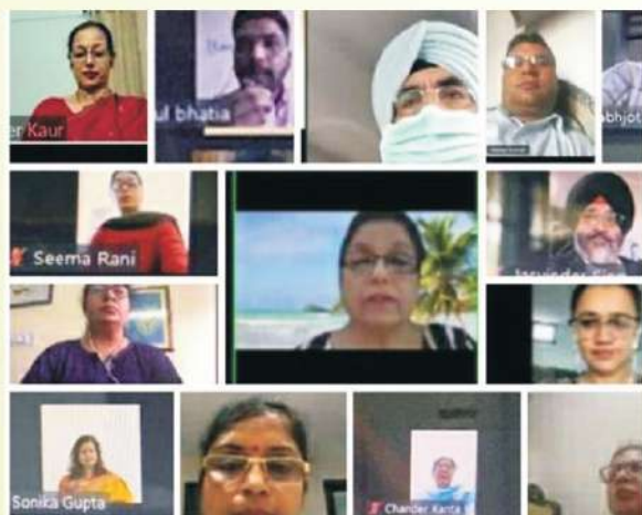
ਕਾਲਜ ਦੇ ਸਾਇੰਸ ਵਿਭਾਗ ਵੱਲੋਂ ‘ਲਾਕਸ਼ਾਡੀਪ ਤੋਂ ਬਾਮਦ ਦੇ ਜੀਵਨ ਦੇ ਰਹਿਣ ਸਹਿਣ’ ਦੇ ਵਿਸ਼ੇ ਉੱਤੇ ਵੈਬੀਨਾਰ ਕਰਵਾਇਆ।