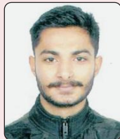
ਸਰੋਮਨ, ਬੀ.ਏ. ਭਾਗ ਦੂਜਾ, ਲੈਂਡ ਸਕੇਪ, ਜੋਨਲ ਯੂਥ ਫੈਸਟੀਵਲ (ਦੂਜਾ ਸਥਾਨ)